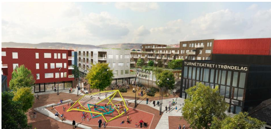
Illustrasjoner fra «DOMUSKVARTALET – revidert mulighetsstudie 04.10.2017» (Pir II).