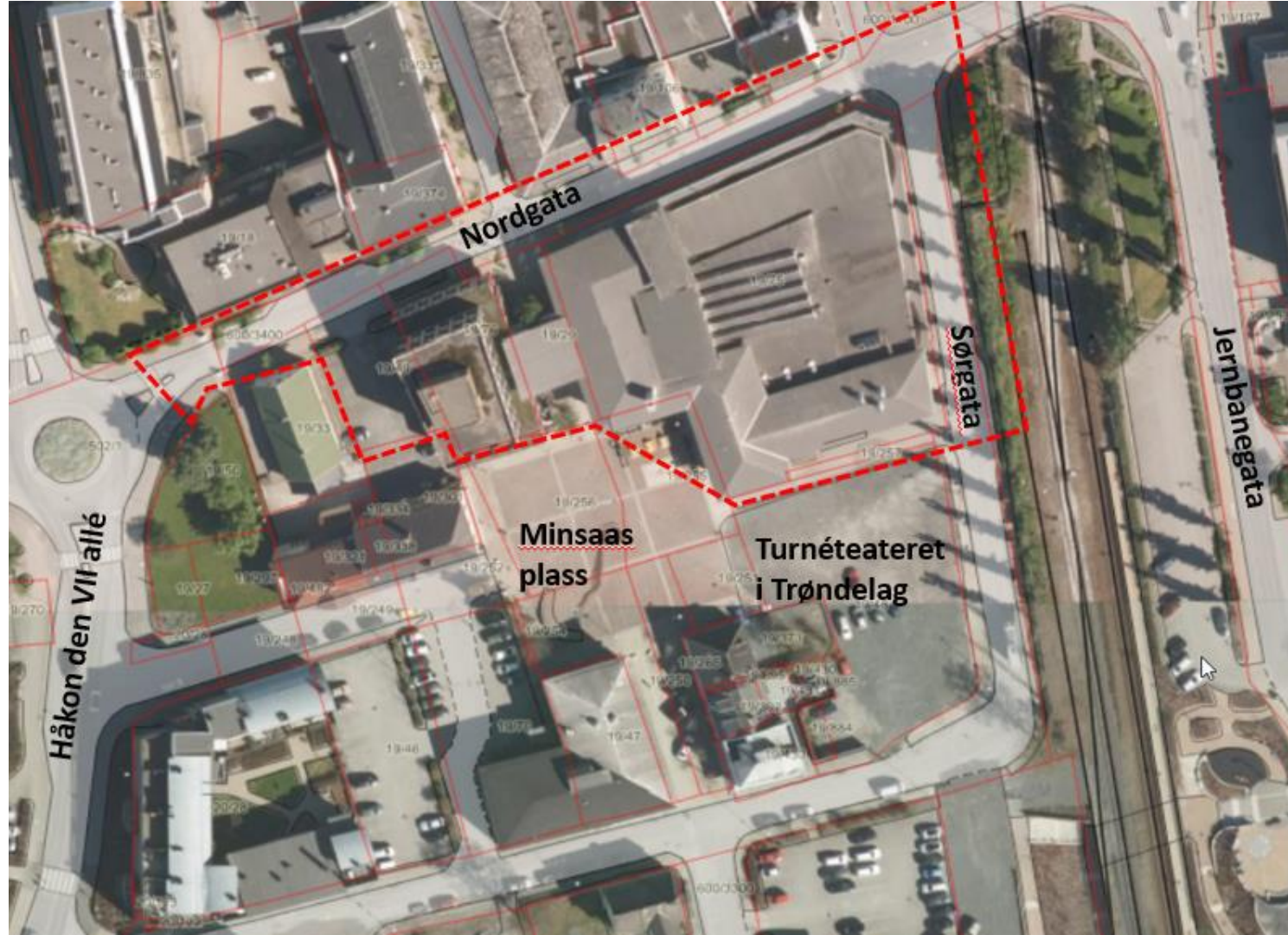
Planområde detaljregulering Nordgata 9, 11 og 13