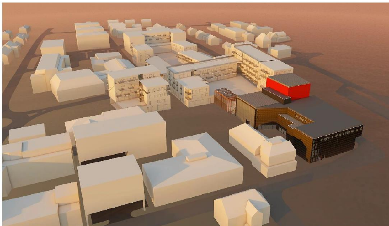
Figur 23: Forslag til ny bebyggelse i alternativ 1, sett i fugleperspektiv fra Minsaas plass.